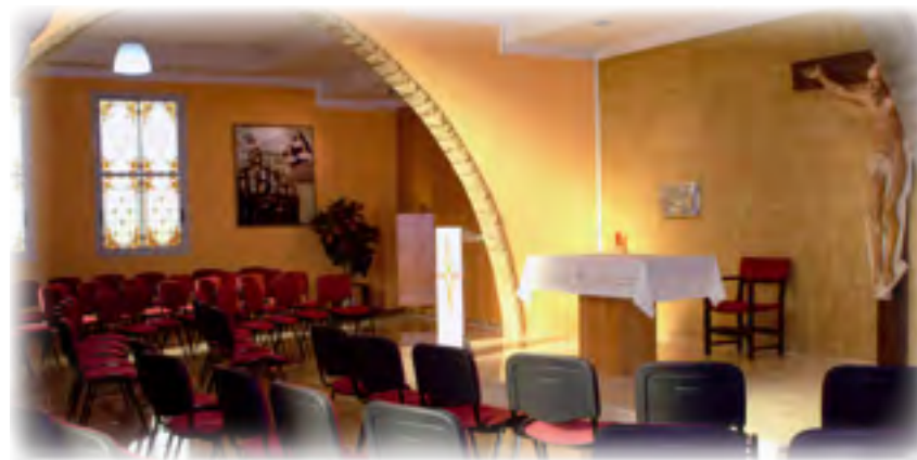
Montiel. Benaguacil. Capilla interior ▲

97. A estas pruebas y tribulaciones siguió para mí otra no menor. El Rvdmo. Padre Provincial Joaquín de Llanerres juzgando, sin duda, ser mejor para las religiosas el que él