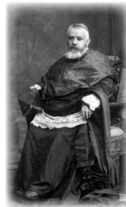
José Calasanz de Llaveneres (Vives y Tutó, Card.) ▲

100. Sin que yo diese publicidad a mi idea y proyecto, bien pronto se esparció la noticia y empezaron a presentármese jóvenes solicitando ser admitidos a formar parte de la nueva Congregación, atraídos, sin duda, por el fin de ocuparse en la instrucción y moralización de los penados, idea que a todos fue muy simpática (117). Esto, y la aprobación y alientos que me daban todas las personas de