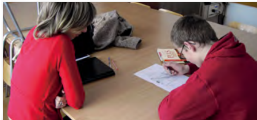
Enseñanza personalizada ▲