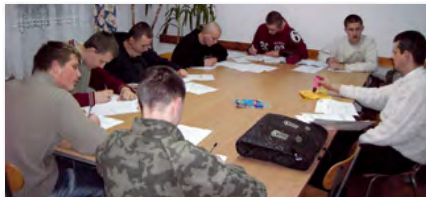
Enseñanza en grupo ▲

En la actualidad es a este tercer cometido al que preferentemente van dedicados los esfuerzos de la fraternidad pues la casa está constituida en la ciudad de Lublín como Centro de Día . Al mismo acuden diariamente 25 jóvenes, de entre 14 y 18 años en situación de alto riesgo, enviados por el juzgado. En el centro reciben clases de ocho de la mañana a ocho de la noche individualmente, y también en grupos, como se puede apreciar en la adjunta información gráfica.